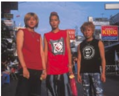
かなり目立っていた日本人旅行者

ワイルンたちが押し寄せるカオサンに儉約型旅行者たちの居場所がなくなっているのも事実だ。旅行者たちが毎日そんなに高いレストランで食べられるはずがない。そこで、世界中を旅するしぶとい旅行者たちは、その居場所をカオサンの周辺部へと替え始めた。周辺に雰囲気のないちよつと小洒落たゲストハウスが建設され、カオサン通り北側のランブトリーという裏通り帯には、テーブルを並べた安い食べ物屋台が立ち並び、麺類やご飯類、焼鳥や焼魚など、酒の肴が安