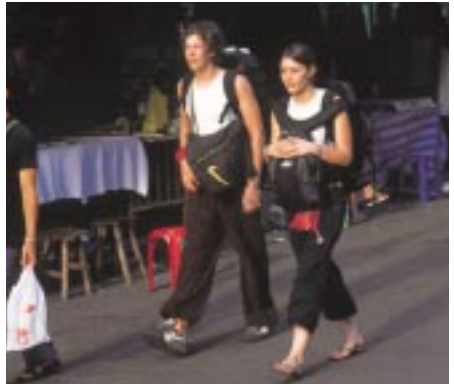
近年、女性旅行者が増えた

人なら敬遠するダークな場所だったのである。タイ人にどこに泊まっているのと聞かれて「カオサン」と答えると、「危ないからちゃんとしたホテルに泊りなさい」と忠告を受けたり、いやな顔をされたりすることもあった。