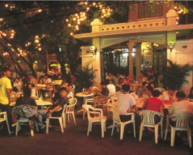
【右上】路地裏に残る昔ながらの下町風情