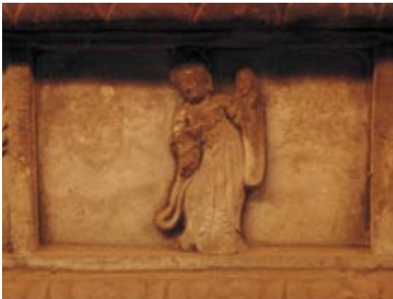
【左下】踊り子の彫刻。ゆっくりした動きの踊りだったと考えられている

ペルシャが起源の琵琶など、異国から渡来したものが混じっている。 唐から五代十国時代の宮廷楽団の様子が描かれた文物でこれほど完璧に保存されているものは他になく、永陵の彫刻は当時の音楽文化を伝える貴重な資料になっている。