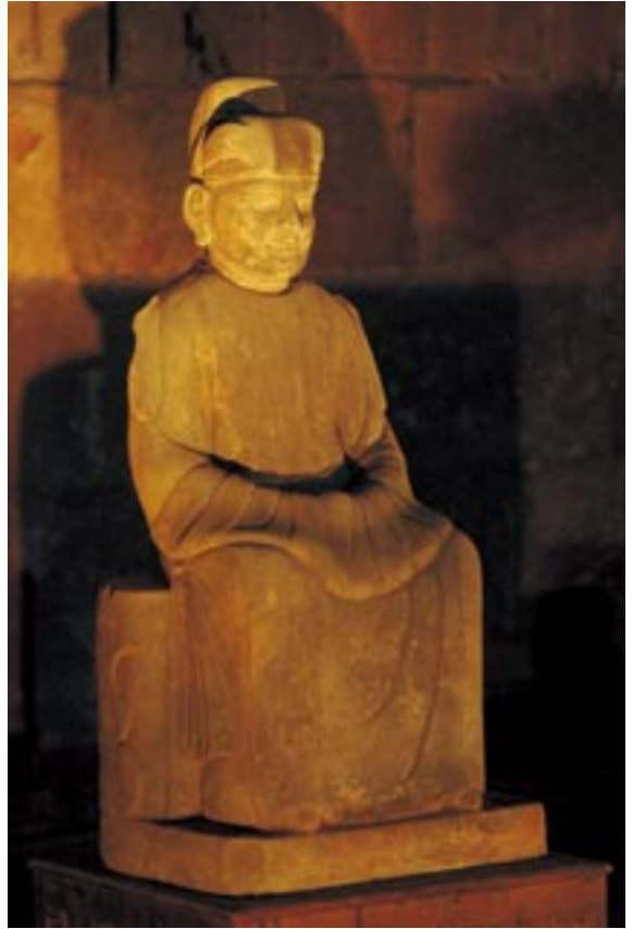
【右頁】琵琶弾きの彫刻