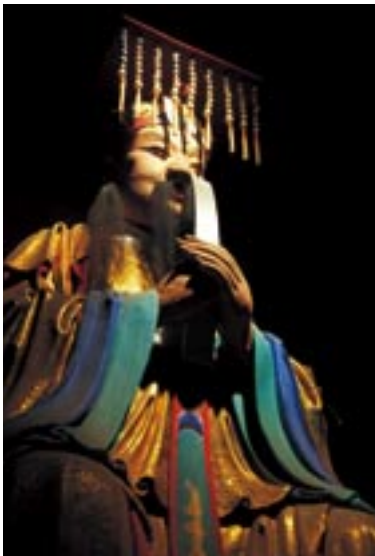
関羽 張飛同様に劉備の護衛官を務め、やがて將軍となる。呉軍に捕らえられて処刑される。

中庭を過ぎると次は劉備殿である。中央に劉備の像、左右に劉備と義兄弟の契りを結んだとされる関羽と張飛の像が祭られている。関羽像は勇ましい造形のものが多いが、この関羽像