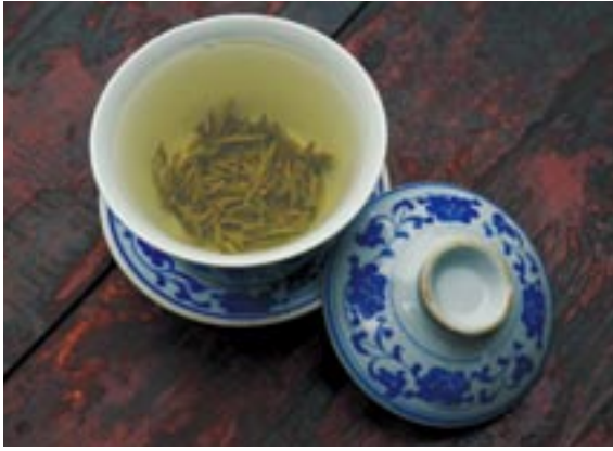
【右】昭覚寺境内の茶館 【左】峨眉山の竹葉青というお茶。まるやかな味

呼ばれる茶碗のセットに茶葉を入れて持つてきてくれる。蓋碗は急須と湯のみ兼用の便利な茶器である。