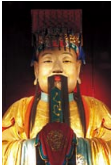
劉備 黄巾の乱平定に手柄を立てて官職を得る。221年に蜀を建国、223年に病死。