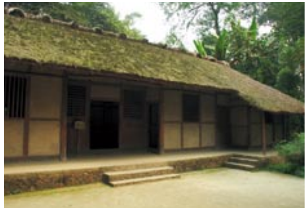
【右上】杜甫の草堂。意外に大きな家である 【右下】薛涛がその水を使い詩箋を作つたといふ井戸 【左下】薛涛の肖像

薛涛は770年に成都で生まれ、14歳の時に官吏であつた父を亡くすと、生活苦から楽妓となる。楽妓とは日本ではいへば芸者のようなものである。売れっ子となつた薛涛の噂を聞いた劍南節度使（四川一帯の総督）の韋皋は、薛涛を公館での宴会に呼び寄せる。この時、薛涛の美しさと詩才に感嘆した韋皋は、宴が催されるたびに薛涛を招くようになったといふ。