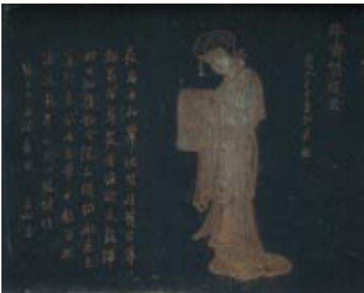
【左頁】錦江対岸から望江楼を望む