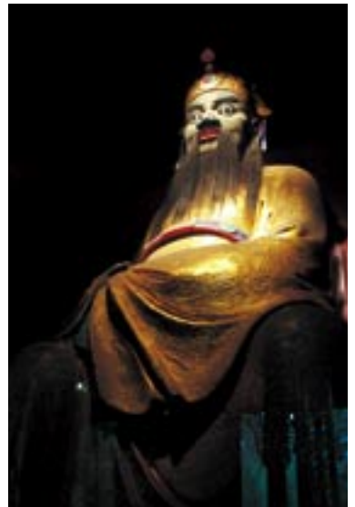
張飛 劉備の護衛官を務め、やがて頭角を現して將軍となる。部下に殺害されて最後を遂げる。