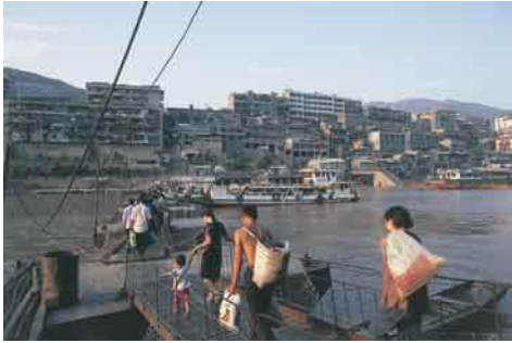
河川交通の要衝・奉節。三峡ダム建設により、この街は水に沈む。住民の多くは移住せねばならない