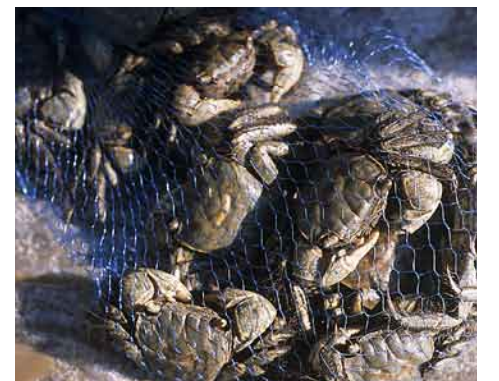
市場で売られるカニ。汚染や乱獲で天然産は激減した

上海から崇明島までは高速船で約45分。帆船で往来していた清の時代は、逆風だと7、8時間もかかったという。このことだけでも河口付近の長江主流