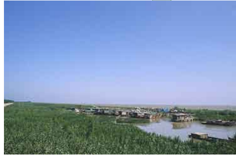
長江の流れと海が融合する地点。はるか向こうまで大海原が広がる(崇明島の東側)。これが長江のさきっぽだ