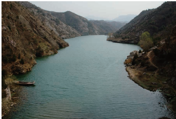
▲鴛鴦湖 燕山山脈から流れ出た水は峡谷の河水となって鴛鴦湖に貯まり、一部は北京市民の水源になる密雲ダムに達する。鴛鴦湖の湖水は金山嶺と司馬台の長城を分け、荒涼とした風景に安堵感をあたえる。