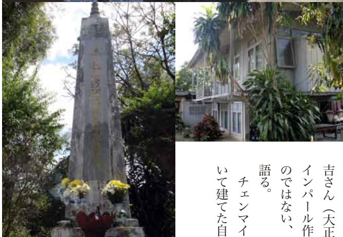
[上]藤田さん宅には近隣在住の日本の方々が折々訪れてくださっている。藤田さんについては、以下の著作に元気な頃のインタビューが掲載されている。『帰還せず』青沼陽一郎著(2006 新潮社)、『望郷』三留理男著(1988 東京書籍) [右]彼が老後を過ごす自宅 [左]彼が戦友のためにたてた慰霊碑には「噫忠烈戦歿勇士の慰霊塔」と刻まれている