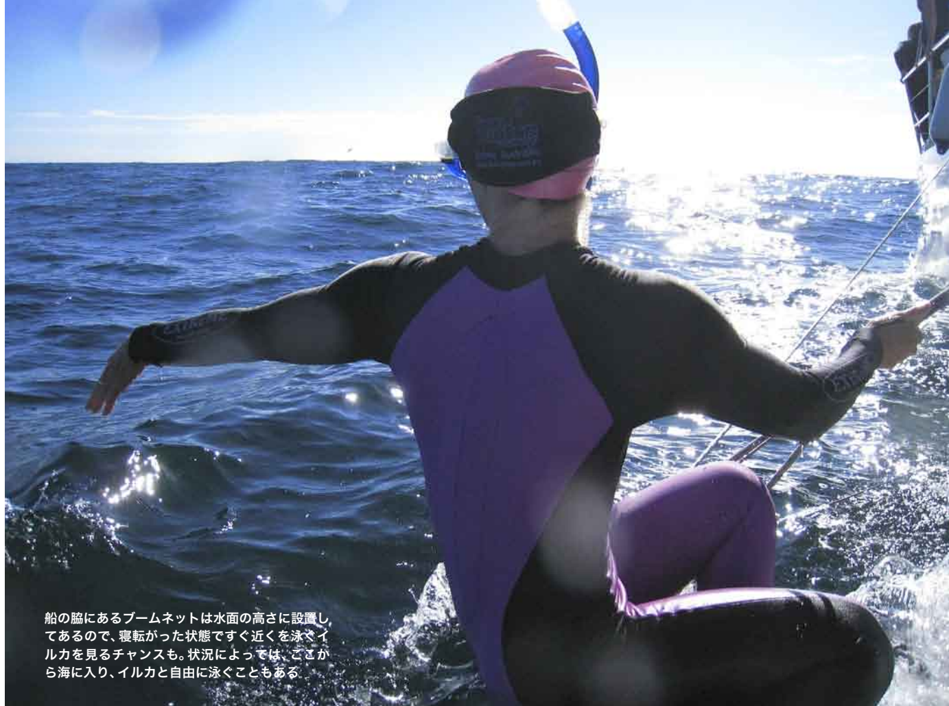
船の脇にあるブームネットは水面の高さに設置してあるので、寝転がった状態で近くを泳ぐイルカを見るチャンスも。状況によっては、ここから海に入り、イルカと自由に泳ぐこともある。