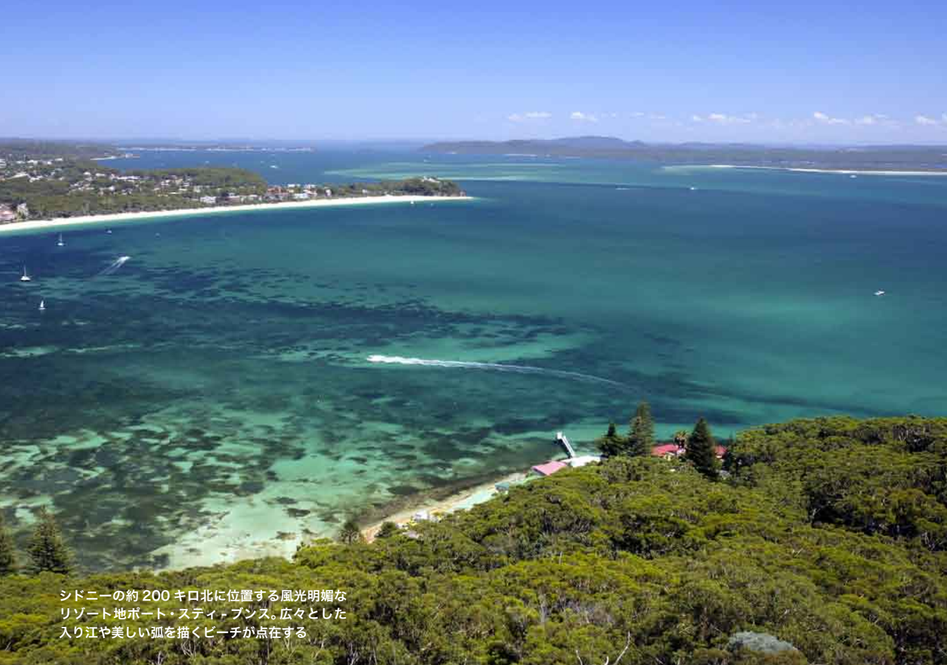
シドニーの約200キロ北に位置する風光明媚なリゾート地ポート・ステイブンス。広々とした入り江や美しい弧を描くビーチが点在する