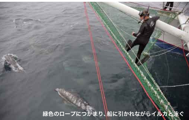
緑色のロープにつかまり、船に引かれながらイルカと泳ぐ

イルカたちは船首の波に乗って、後になり先になりして自由自在に泳いでいる。ロープにつかまって浮遊しながら、すぐ傍にいるイルカを眺めていると、すっと思考や感情が解き放たれる。顔を上げると周りに笑顔の花が咲いているのが見え、心地よい高揚感と幸福感にすっぽりと包まれた。