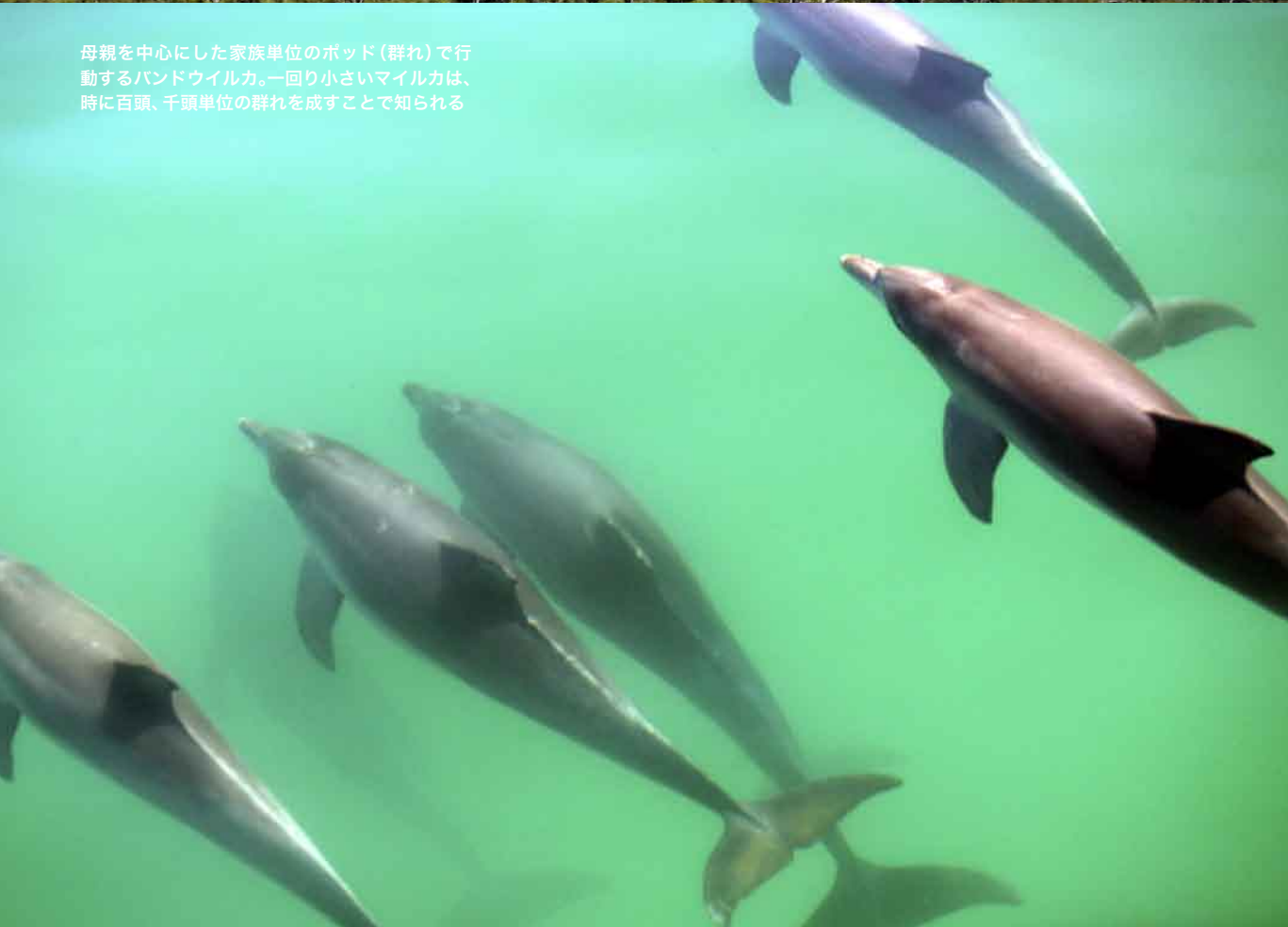
母親を中心とした家族単位のポッド(群れ)で行動するバンドウイルカ。一回り小さいマイルカは、時に百頭、千頭単位の群れを成すことで知られる

野生のイルカと泳いだ人は誰もが口を揃えて、それを特別な癒し経験だったという。しかしながら、その体験も十人十色で、客観的に共有することは至難の業だ。ともすれば神秘化されて語られることもあり、非科学的との批判も否めない。