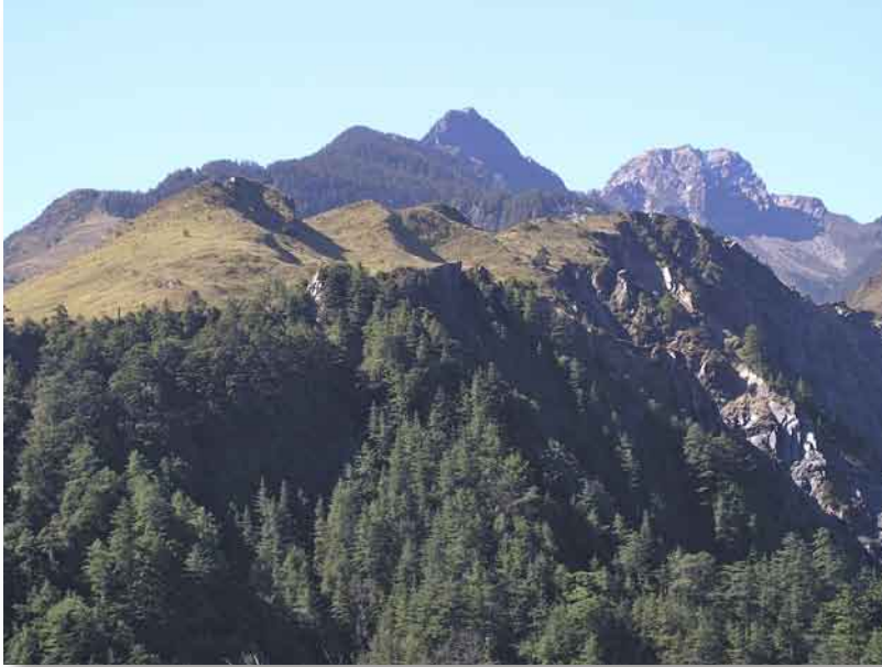
観高から望む玉山連峰