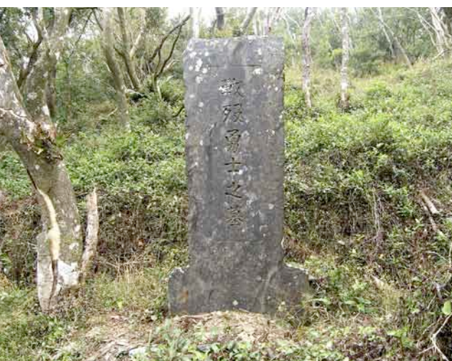
[上]当時のリキリキ社で撮影された古写真。雪豹の毛皮で作った頭目の礼服を着た男性。左足下には、二つの杯をつなげた連杯がある。祝いの席で二人で一緒に酒を飲む時に使われる。 [左]クナナウ社にある「戦歿勇士之墓」。第二次世界大戦末期、日本軍は台湾原住民から成る高砂義勇隊を編制した。合計7回編制され、フィリピンをはじめとする南洋諸島の戦闘に投入された。軍人ではなく軍属という扱いだったが、実際の戦闘に参加、多数の戦死者が出た