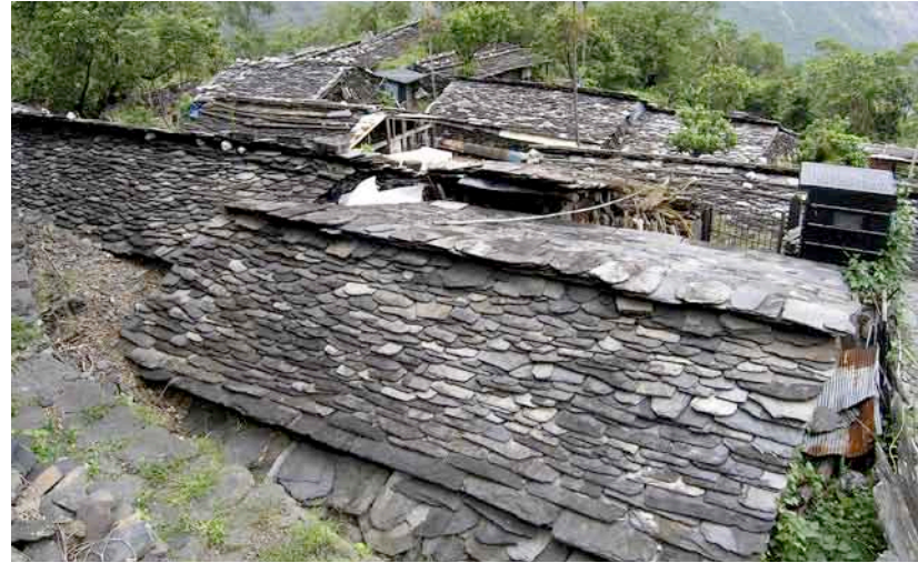
■右頁[右上]ボガリ社旧集落の住居跡に残る表札。戦後も相当長い期間(一部地域では現在でも)カタカナが使われていた [右中央]ボガリ社の祭場の祠の石板に彫られた守護神 [右下]ブツンロク社とボガリ社を結ぶかつての警備道 ■左頁[右上]チカタン社の伝統集落の藁の波 [左上]北大武山頂上稜線に残る日本統治時代の大武祠。鳥居階段の袂には高砂義勇隊顕彰碑の碑文のみが残る。60年の風雪(南台湾でも高地は積雪する)に耐えた木製の鳥居は、パシー海峡と南洋諸島を向いている