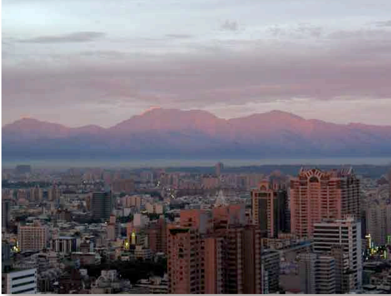
高雄市街より望む大武山山塊