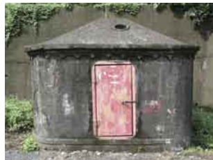
地下ダム横にある取水塔。昨年の台風で倒壊したが、ダムは機能している

当時台湾製糖株式会社の社長だった鳥居信平がサトウキビ畑への灌漑のため設計し、1923年(大正12年)に完工。水源は周辺にパイワン族が多く居住する林辺溪。水の豊富な雨季はそのまま河川を流れる水を利用し、河川を流れる水量が減少する乾季、早魃時は河床下に潜った伏流水を集めそれを灌漑に利用する集水システムである地下ダムを含むため、今でも水利専門家の耳目を集める。