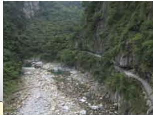
サカダン歩道(写真右側)

サカダン(砂卡礑)歩道は、タロコ(太魯閣)峡谷を流れるタッキリ(立霧)溪の支流にダムや発電所への送水施設を建設するため、1930年に開削された工事道。大理石の岩盤を人力で削り出したもので、全長4キロ強。往復約3時間で歩ける平坦な道で、豪快な渓谷美を楽しめる。