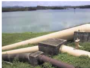
烏山頭ダムの取水管

1920年から10年の歳月を費やし完成した満水面積1,000ヘクタールの烏山頭ダム(珊瑚潭)と総延長16,000キロに及ぶ灌漑水路。その設計、施工を指揮し、台南・嘉義に渡る平野を台湾第一の穀倉地帯に変えた八田與一は、妻の外代樹ともども悲劇的な最期を遂げたこともあり、台湾の恩人として、台湾の教科書にも登場する。今や日本でも知られるようになり、現在、烏山頭ダムを世界遺産に登録しようという運動も始まった。