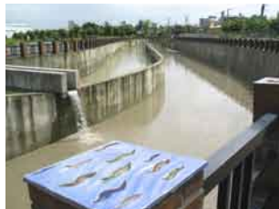
曹公圳は台湾三大古圳の一つ

高雄県と屏東県の県境を流れ、台湾海峡に注ぐ高屏溪の水を高雄地区一帯に配水する曹公圳は、清朝道光年間に開削が始まり、日本統治時代に多くの支線が設けられた。1911年竣工の竹寮取水站はゴシック様式と中国様式を折衷した斬新なデザインの建築物がほぼ当時の姿で残る。高屏溪に架かる下淡水溪鉄橋(通称高屏旧鉄橋)の高雄側は旧鉄橋湿地教育園になっており、園内外に日本統治時代の遺跡・遺構が多く、曹公圳もそのひとつ。