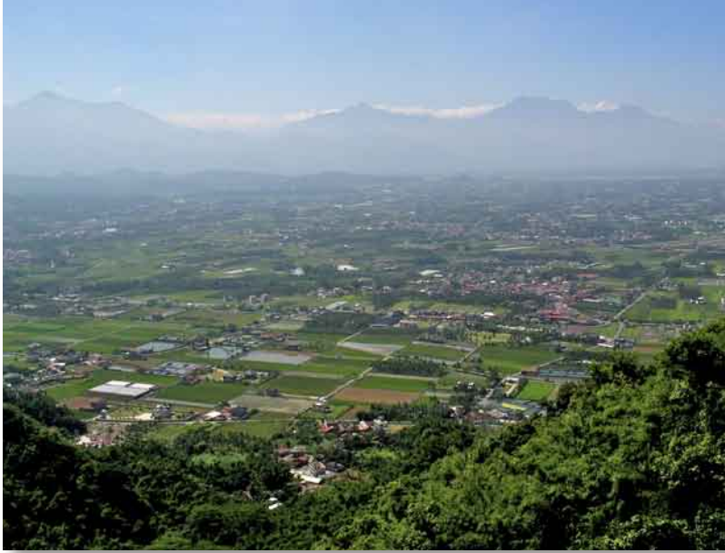
旗尾山より望む高雄県美濃の田園