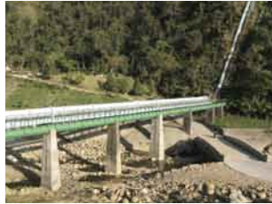
緑色の水管が日本統治時代のもの。1999年の921地震で破損し、今は隣の水管が使われている

白冷圳は、磯田謙雄がサトウキビ種苗畑の灌漑のため設計し、1932年に完工した全長約17キロの水路。水源は台中県北部から台湾海峡に注ぐ大甲溪。標高500メートルほどのところにある取水口と出水口は、高低差はわずか20メートルで、その間を22本のトンネル、14架の水橋、3本のサイフォン水管で繋ぐ。2号管の巨大なサイフォンは台湾歴史建築百景のひとつで、同百景最大の建築物だ。