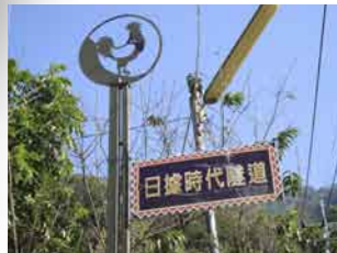
トンネルを指し示す標識。タマロワンはブマン語で雄鶏のこと