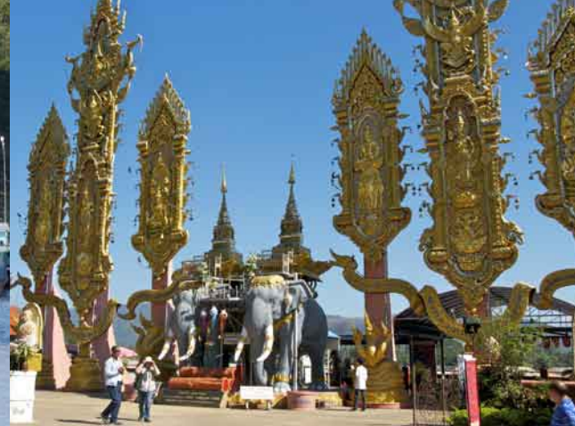
ソップルアックは街全体がまるで遊園地の様相