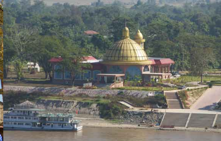
中国資本によって開発中のラオス金三角経済特区

メコン河畔に並ぶ極彩色に塗られた張りぼてのモニュメント、林立する土産物屋や食べ物屋、対岸のラオス領に鎮座する金色屋根を頂いたいかにも安普請のアラビア風ドーム。まるで三流のテーマパークにでも迷いこんでしまったかのようだ——タイ、ラオス、ミャンマーの三国が国境を接するエリア、いわゆるゴールデン・トライアングルのタイ側の街ソップルアックの光景である。今となつては、ここがかつて辺境の寒村だったころの面影を探すことはむずかしい。