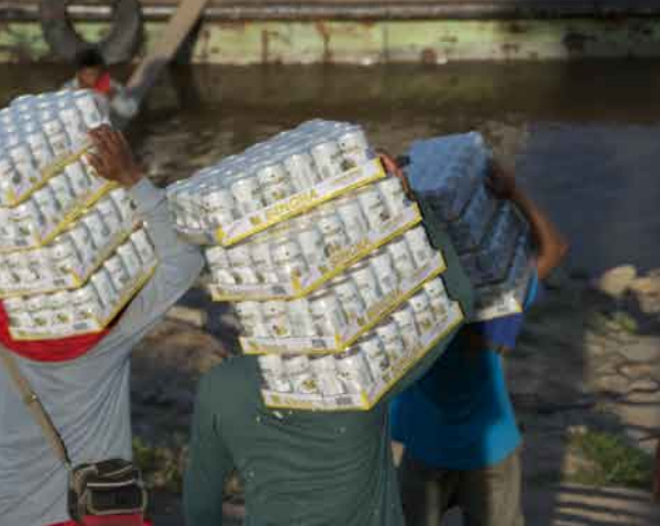
雲南へ戻る貨物船にシンハービールを積み込むタイ人苦力