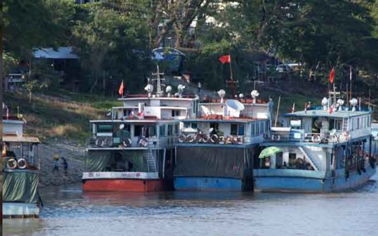
チェンセーンのリム川河畔に停泊する中国船