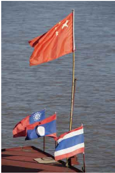
上) 貨物船に掲げられた中国、タイ、ラオス、ミャンマーの国旗。中国船なので中国の旗が大きいのだが、なにやら力関係を暗示しているように見えてしまう