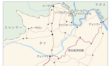
*南北経済回廊チェンコン・チェンライ間には他のルートもある